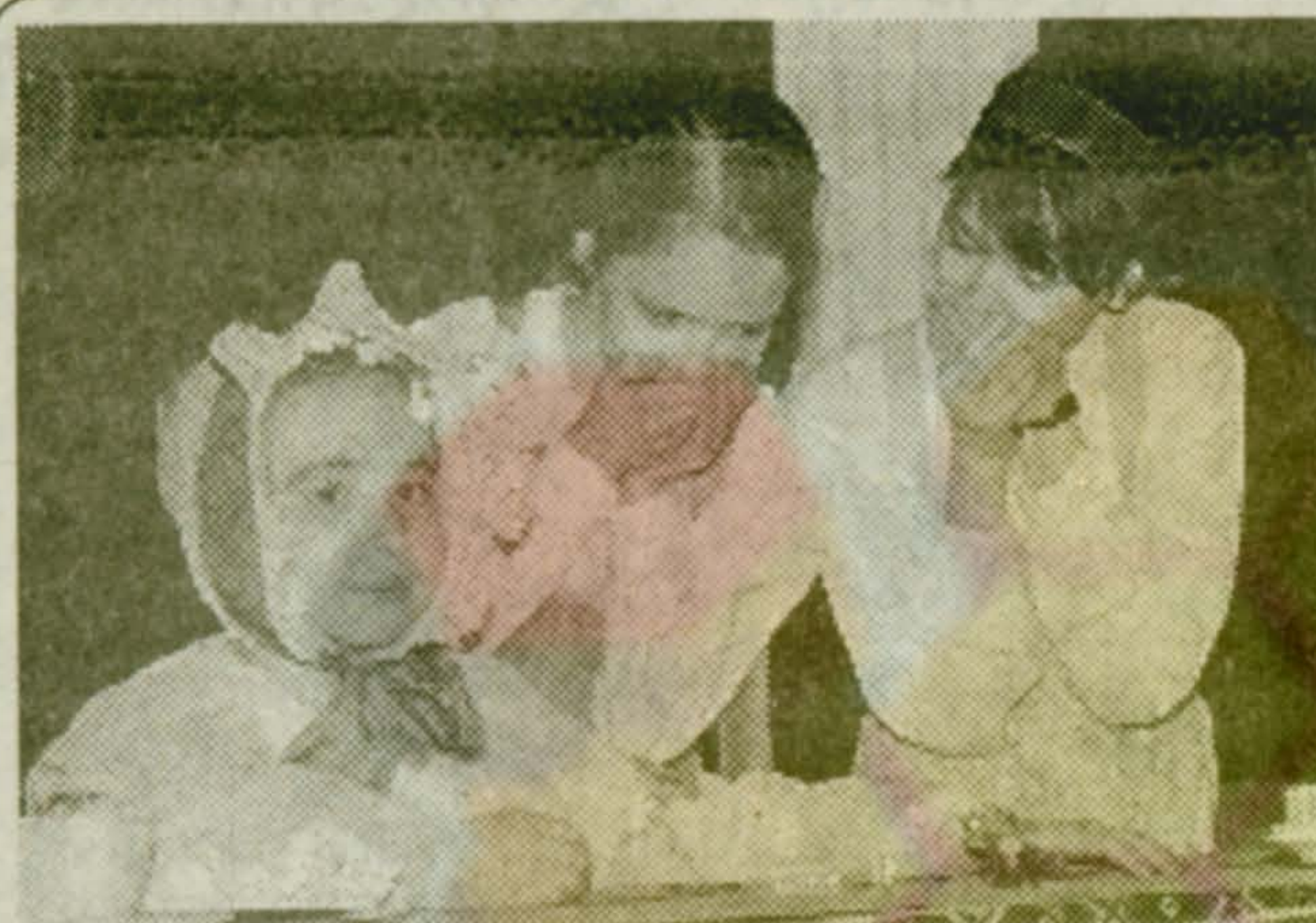
Окончание. Начало на 1 стр.

■ ОТ РЕДАКЦИИ. Это письмо направлено депутату Государственной Думы Федерального Собрания Российской Федерации от Люберецкого округа № 107, нашему земляку С.Б. Попову. Его ответ на это письмо будет опубликован в газете "Наше Красково".