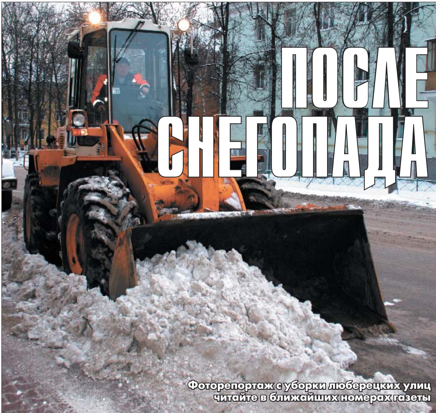
Фоторепортаж с уборки люберецких улиц читайте в ближайших номерах газеты