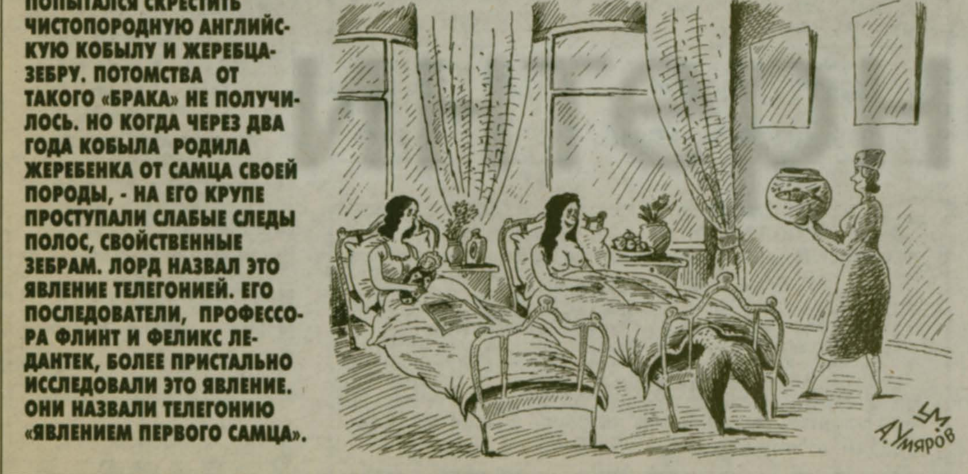
Еще раз о телогонии

Явление телогонии было открыто около 150 лет назад, наиболее известен опыт Лорда Мортонга, занимавшегося биологией под влиянием своего близкого знакомого, основателя теории эволюции Чарльза Дарвина. Он попытался скрестить чистопородную английскую кобылу и жеребца-завра, потомства от такого брака не получилось. Но когда через два года кобыла родила жеребенка от самца своей породы, - на его крупе проступали слабые следы полос, свойственные зебрам. Лорд назвал это явление телогонией. Его последователи, профессор Флинт и Феликс Ледантек, более пристально исследовали это явление. Они назвали телогонию «явлением первого самца».