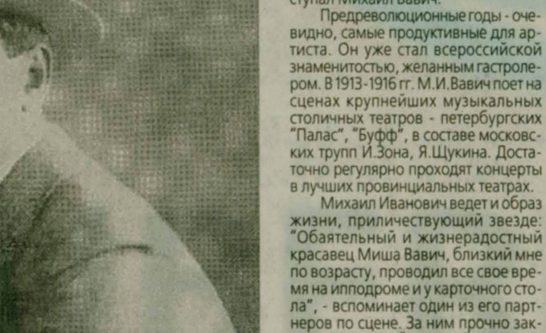
Ветер с севера.