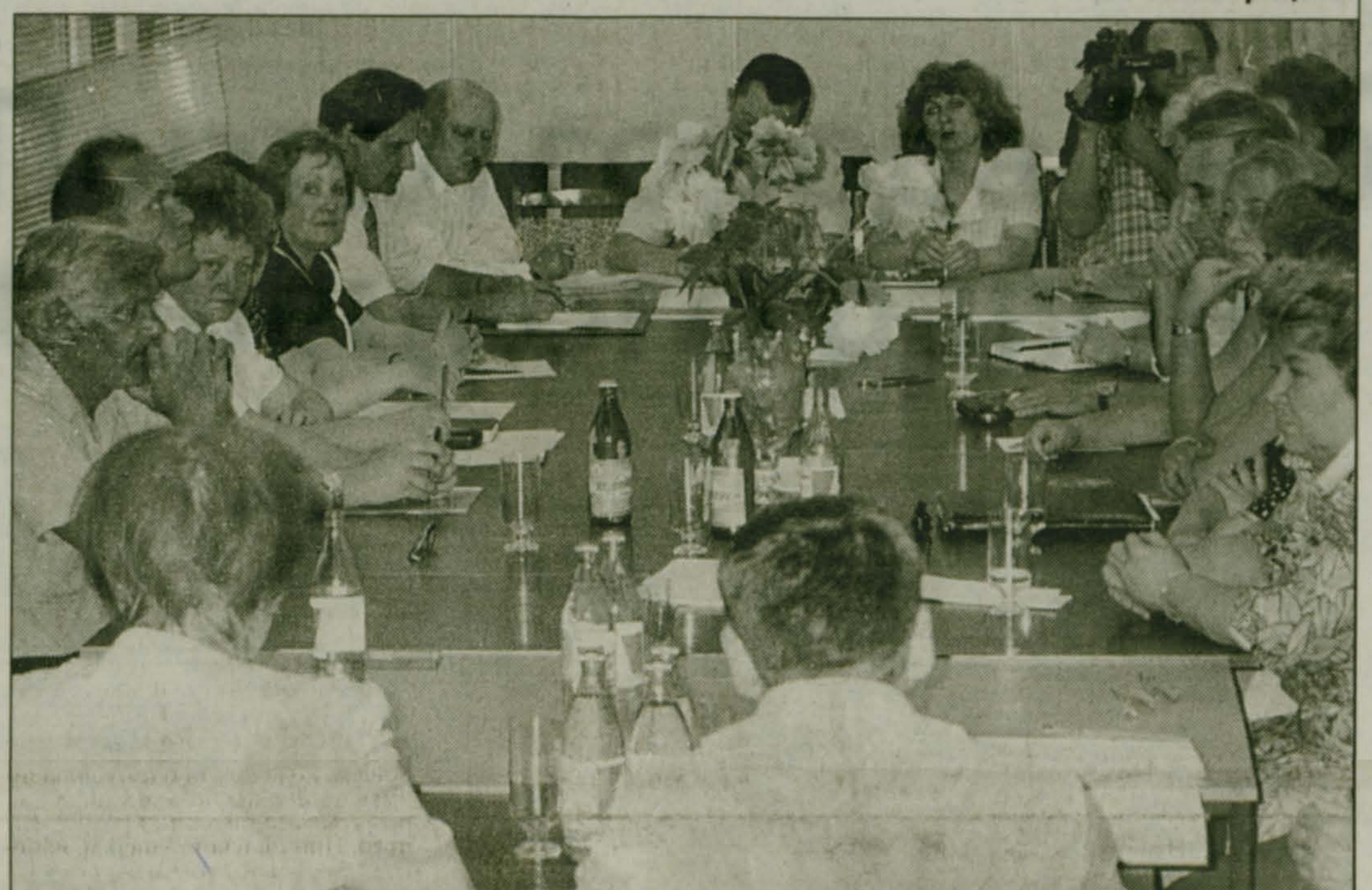
Участники "круглого стола" медиков

Олег БУЗУЛУК На снимках: Г.Л. Васильева; С.К. Черников; участники "круглого стола" медиков.