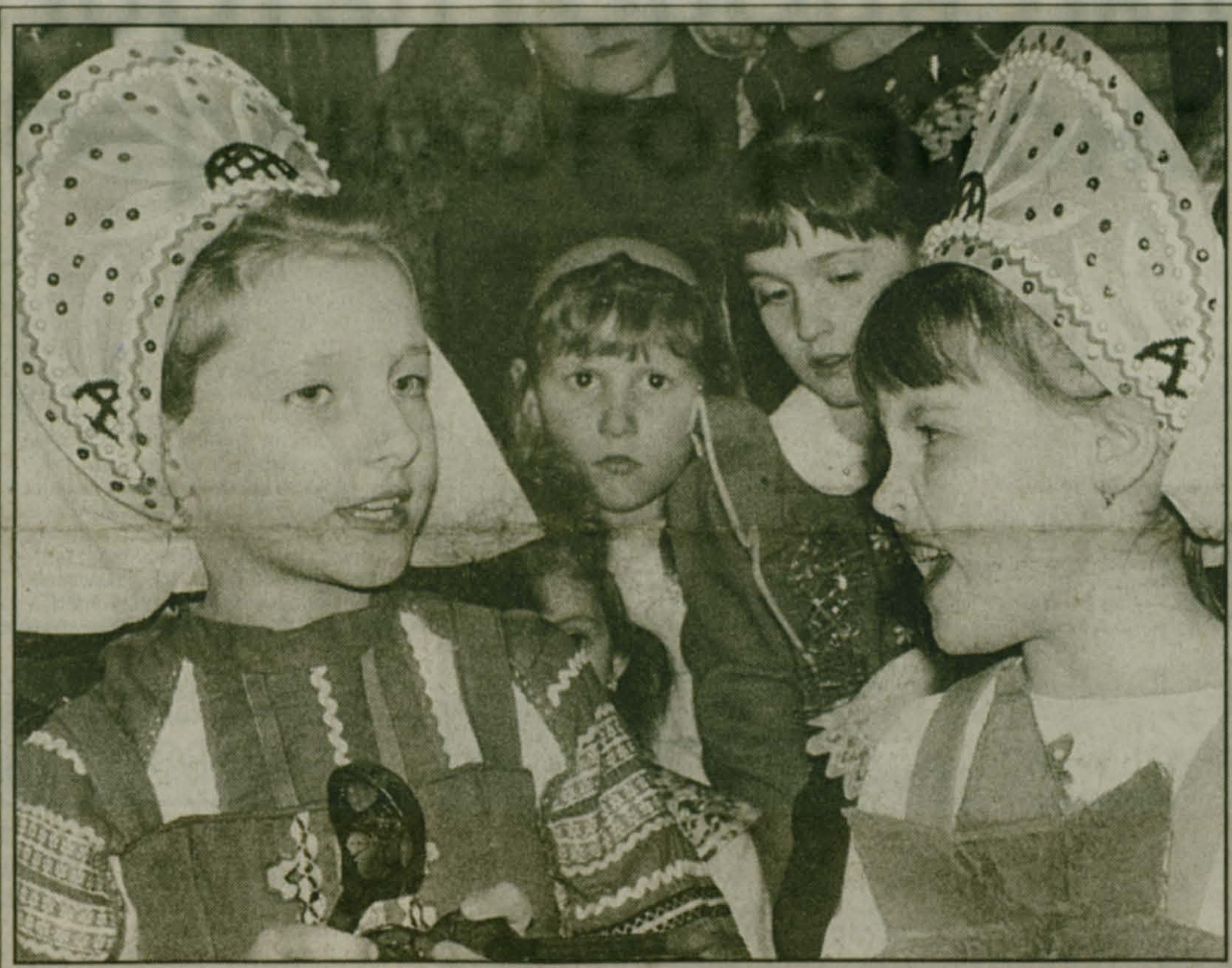
Юные артисты перед выходом на сцену.