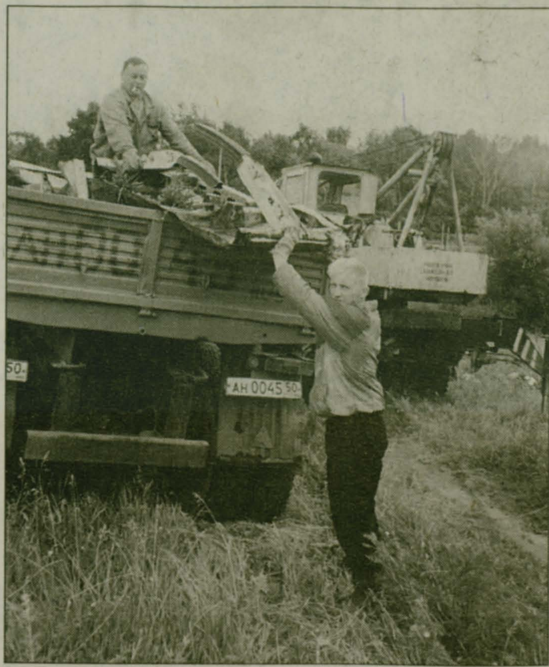
На снимках: в Томилинском регионе идет ликвидация свалок.