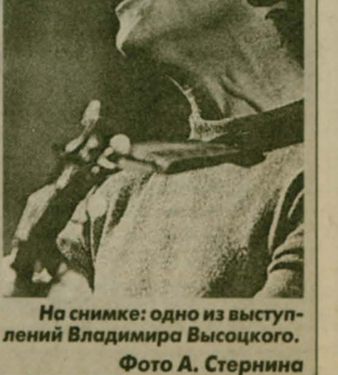
На снимке: одно из выступлений Владимира Высоцкого.

ственного напряжения. Пел дерзко и насмешливо, разоблачая и подшучивая. И ненавидя - мешан, снобов, проявления "верности с собой", "холодного цинизма". Пел - словно в первый и последний раз. Сейчас, когда о Высоцком написано много книг, сделаны телепередачи и кинофильмы, остается бесспорным одно - он феномен, личность, явление. Таким он и пройдет через поколения. 25 июля его могила на Ваганьковском кладбище снова будет усыпана цветами... И вспоминаются строки Б. Ахмадулиной: Эта смерть не моя - есть ущерб и зачет Жизни кровно моей, лобом упершейся в стену.