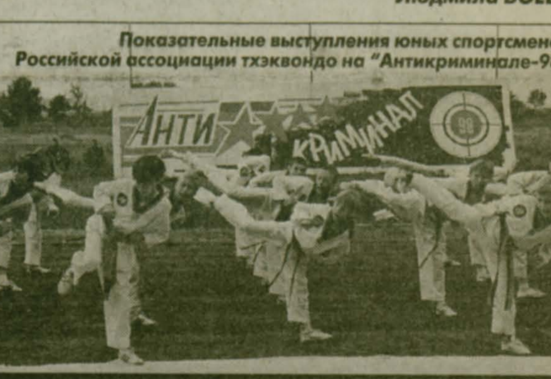
Показательные выступления юных спортсменов Российской ассоциации тхэквондо на "Антикриминал-98"