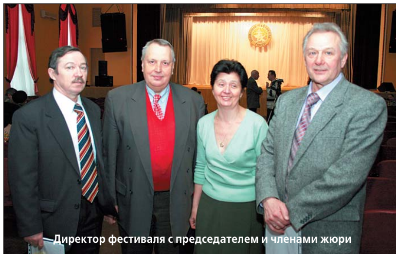
Директор фестиваля с председателем и членами жюри