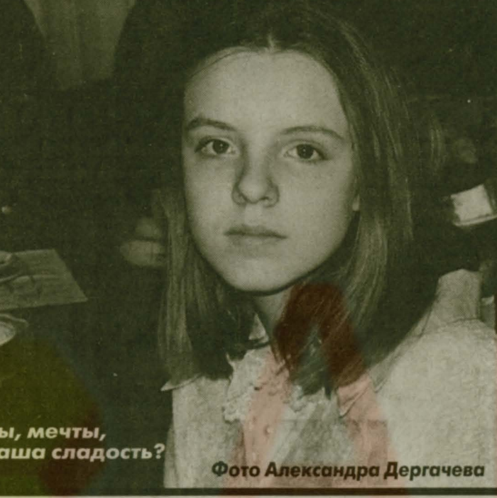
Мечты, мечты, где ваша сладость?