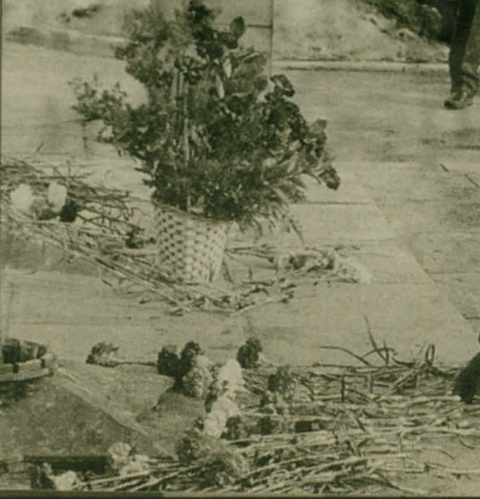
Цветы к Вечному огню