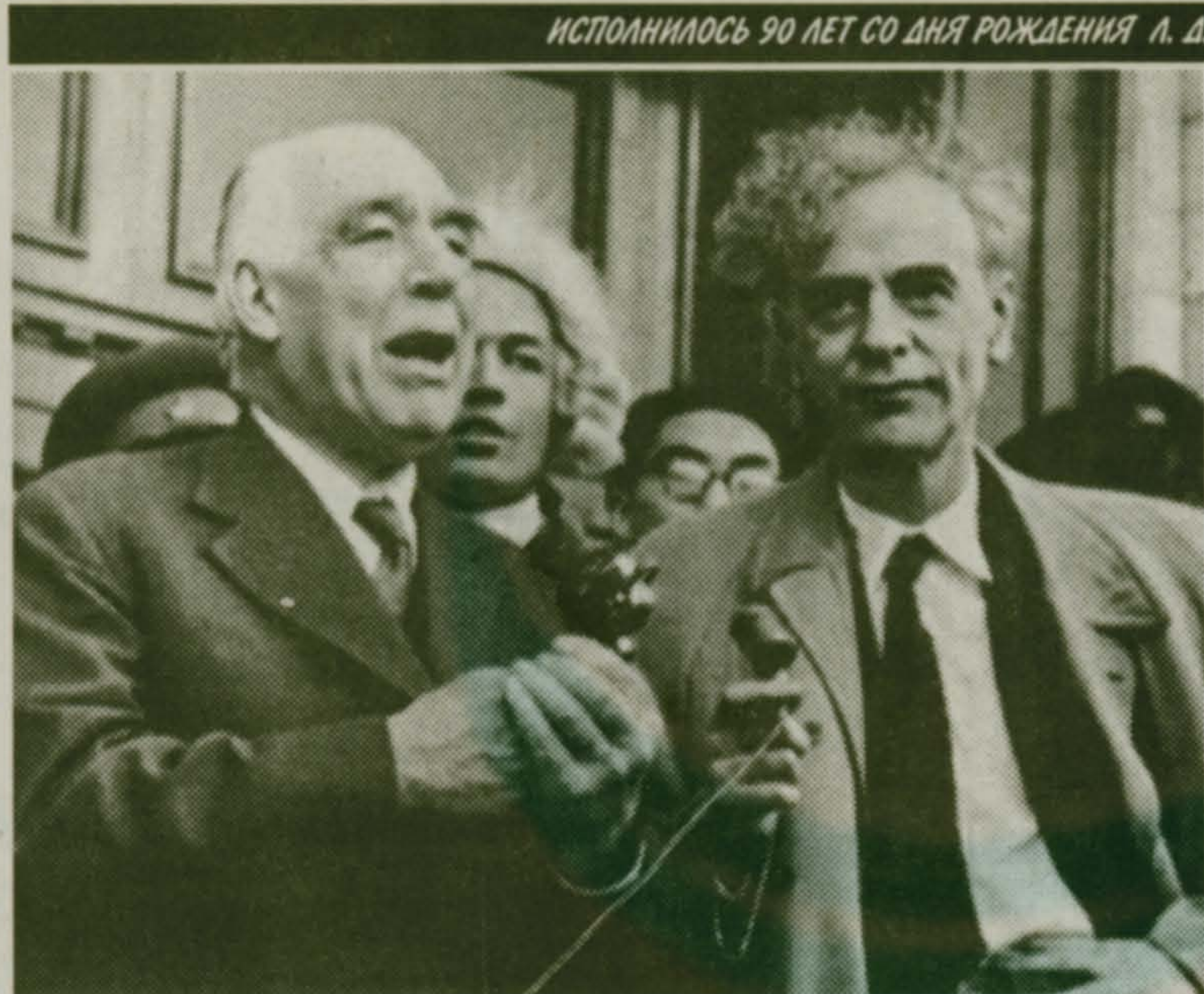
ИСПОЛНИЛОСЬ 90 ЛЕТ СО ДНЯ РОЖДЕНИЯ Л. Д. ЛАНДАУ

22 января исполнилось 90 лет со дня рождения Льва Давидовича Ландау, выдающегося ученого-физика. Прожил он недолгую жизнь, но колоссальную по значимости для науки. 1 апреля мы будем почитать его в тридцатилетнюю годовщину со дня смерти.