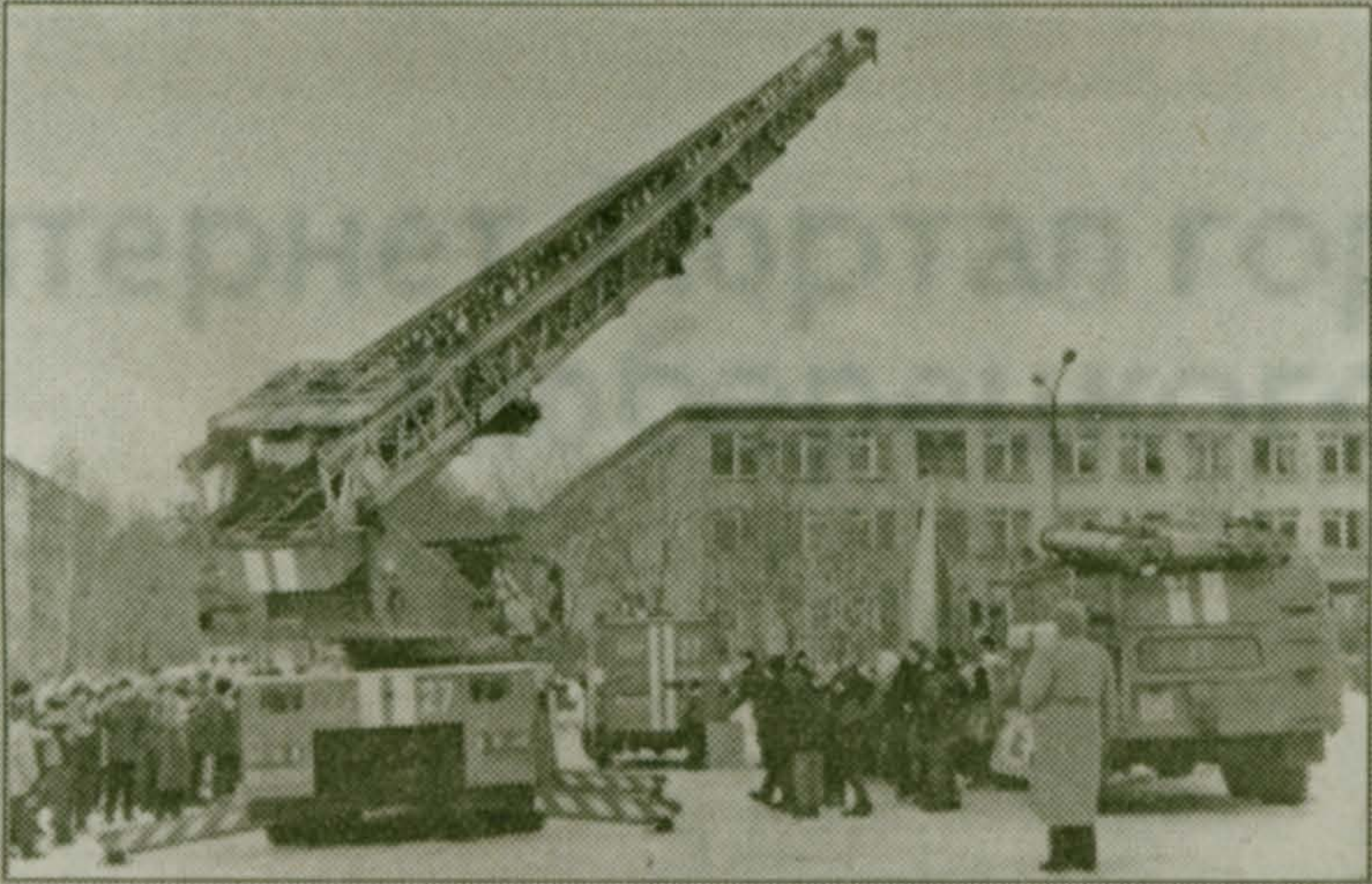
18 марта Люберецкий гарнизон пожарной охраны проводил в нашем поселке показательные агитационные учения. Такие мероприятия проводятся ежемесячно в различных населенных пунктах района, в случае повышенной пожарной опасности — и чаще. Для малаховских детей это было целым событием — к приезду пожарных собрались ребята из 52-й и 47-й школ, школы "Образ", воспитанники 150-го детского сада. Учения проводили 10 сотрудников пожарной охраны под руководством подполковника В. А. Абрамова. Техника выглядела более чем внушительно: 52-метровая автолестница, автомобиль быстрого реагирования, автоцистерна с мощным насосом. Пожарные продемонстрировали работу специальных ножниц для резки металла, затем был устроен учебный пожар, с успехом погашенный. Впечатлений у ребят осталось много, тем более, что им были вручены памятные знаки и красивые агитационные материалы. На снимках: идут учения; капитан Люберецкого гарнизона Вячеслав Сидоров.