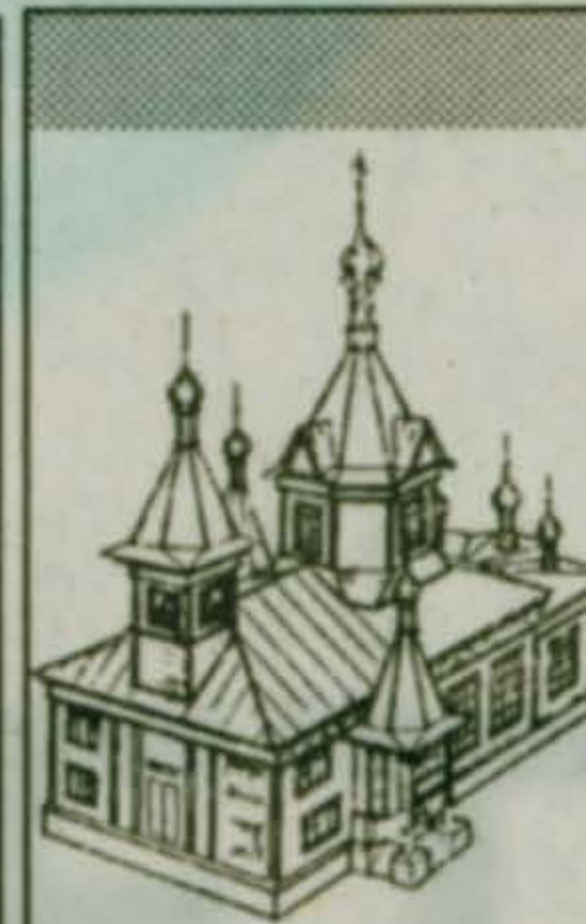
В МАЛАХОВСКОМ ХРАМЕ ПЕТРА И ПАВЛА

может она поведать тем, кто связан с Малаховкой жизнью, работой или воспоминаниями? Давайте вместе поищем ответы на эти вопросы...") Сегодня мы можем ответить на многие вопросы, поставленные в нашей "песни". Да, мы уже кое-что знаем "о событиях на нашей улице и на соседнем предприятии". Стремимся узнать больше о том, что происходит в нашей жизни (совершенству нет предела). Но главное — газета нужна всем нам: кому-то больше, кому-то совсем чуть-чуть, а кто-то (есть и такие) и не знает о ее существовании и о том, что именно она и способна помочь ему в трудный час. Соседи, расскажите ему, пока не поздно! "Если вы закроетесь, мы умрем", — сказала нам как-то сердобольная читательница. Конечно, таких немного (а все же они есть!), но ведь и те, для кого "МВ" — лишь дешевая телепрограмма, тоже нас читают. И соглашаются, и спорят с нами. Всем никогда не угодишь. Для читателей "Родины", мешающей правду с ложью, лишь бы накалить страсти и оболванить обывателя, "Вестник", понятно, — слишком умеренное издание. Но мы никогда и не стремились к скандальности. Наша задача — иная. И эту линию мы выдерживали все семь лет: "Чтобы двигаться вперед, нам необойдимо прежде оглянуться. Чтобы осоз-