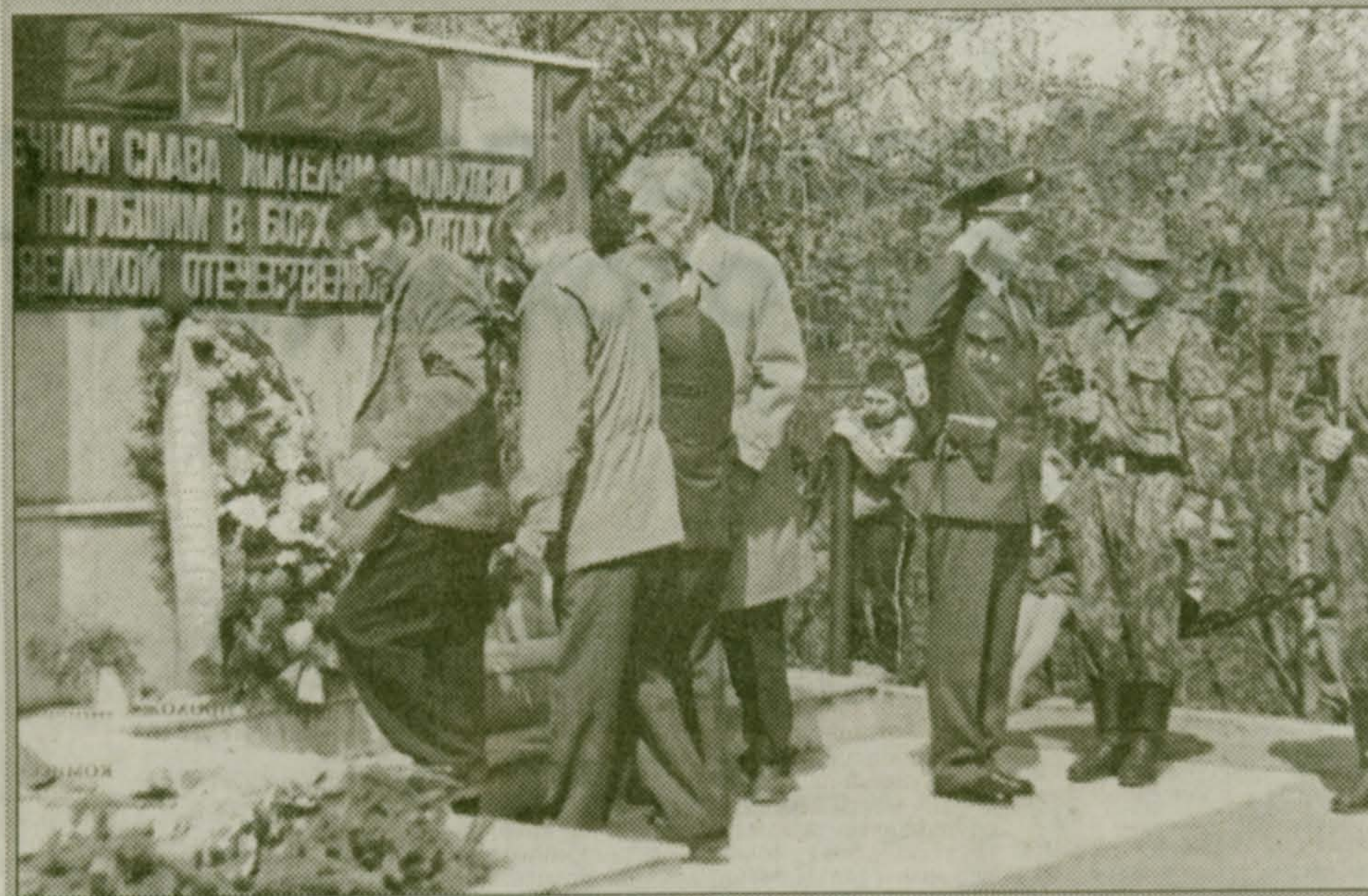
Фото и текст П. САЖИНА.

Сегодня здесь собрались ветераны и школьники, представители администрации и общественности. Звучала музыка и светило солнце. Прекрасный весенний день — достойному празднику.