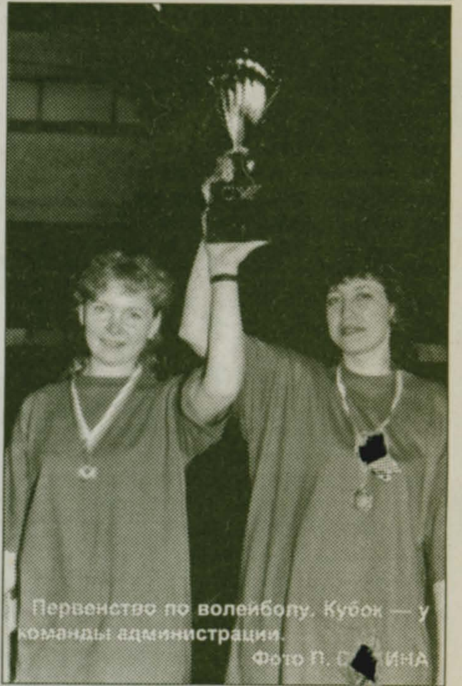
Первенство по волейболу. Кубок — у команды администрации.