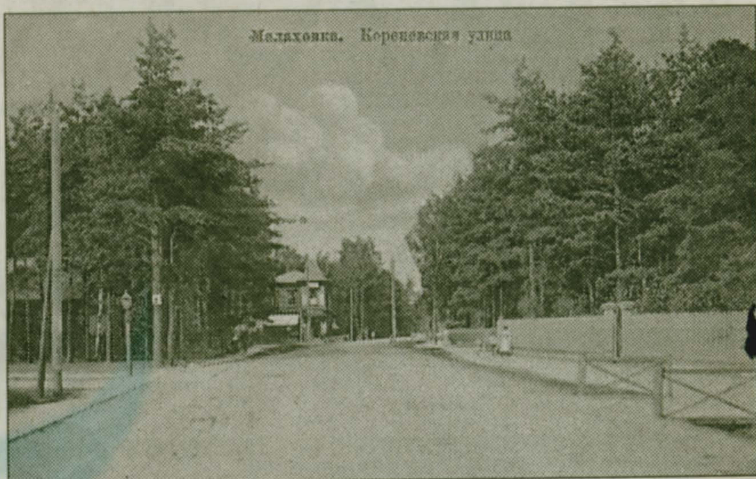
Малаховка. Кореневская улица