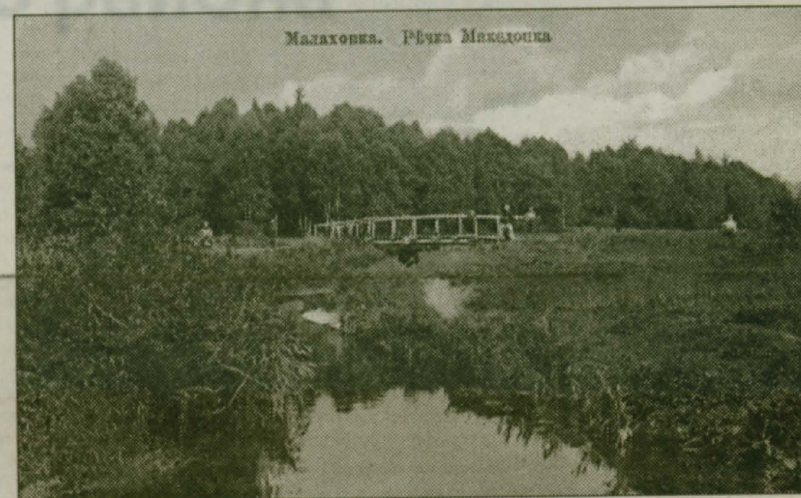
Малаховка. Речка Македонка