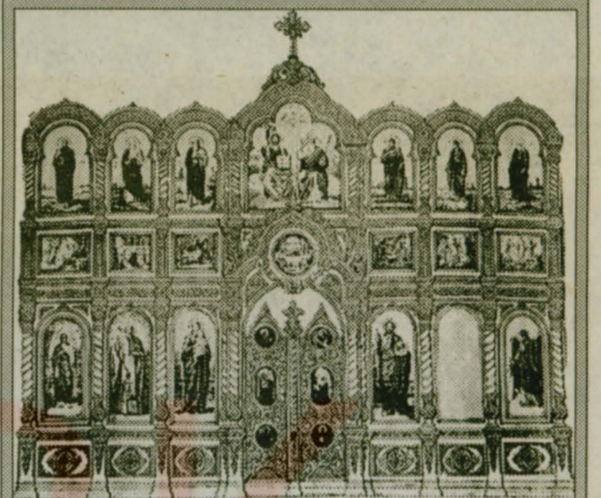
На снимке: эскиз будущего иконостаса центрального придела храма Петра и Павла. Чтобы он стал таким, требуется ваша помощь!