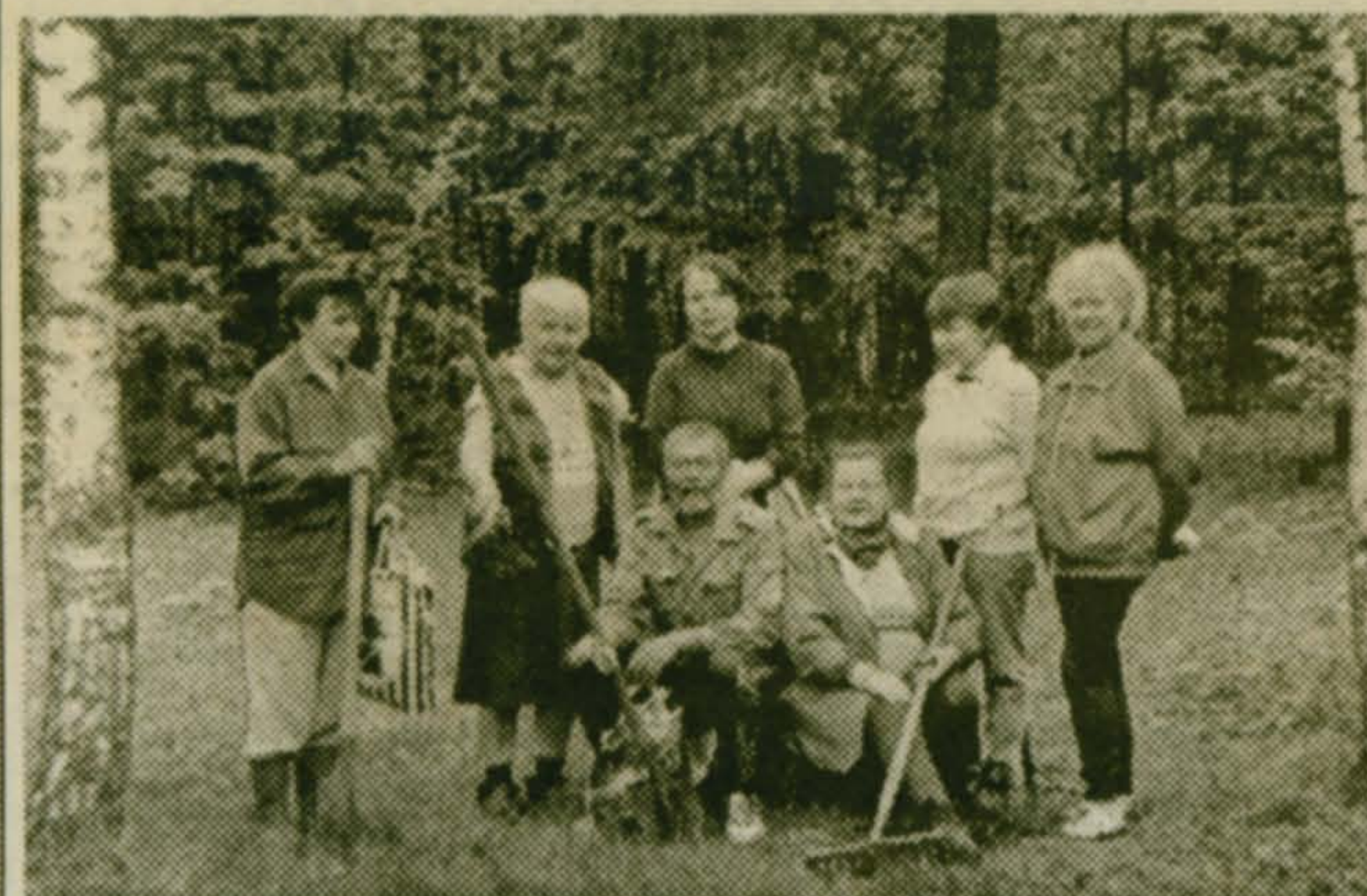
На снимке — группа малаховских жителей, решивших этим летом «прибраться» в «лесу на Плаховом», что между улицами Центральная и Островского. Собрать весь мусор оказалось задачей неподъемной, но хоть что-то удалось сделать.