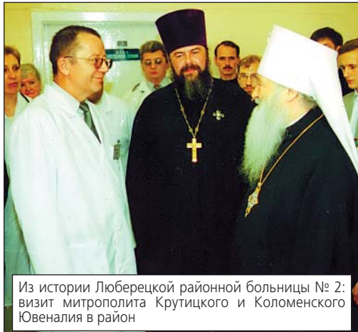
Из истории Люберецкой районной больницы № 2: визит митрополита Крутицкого и Коломенского Ювеналия в район