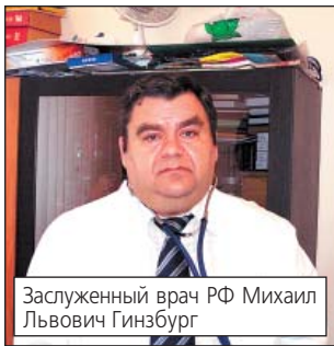
Заслуженный врач РФ Михаил Львович Гинзбург