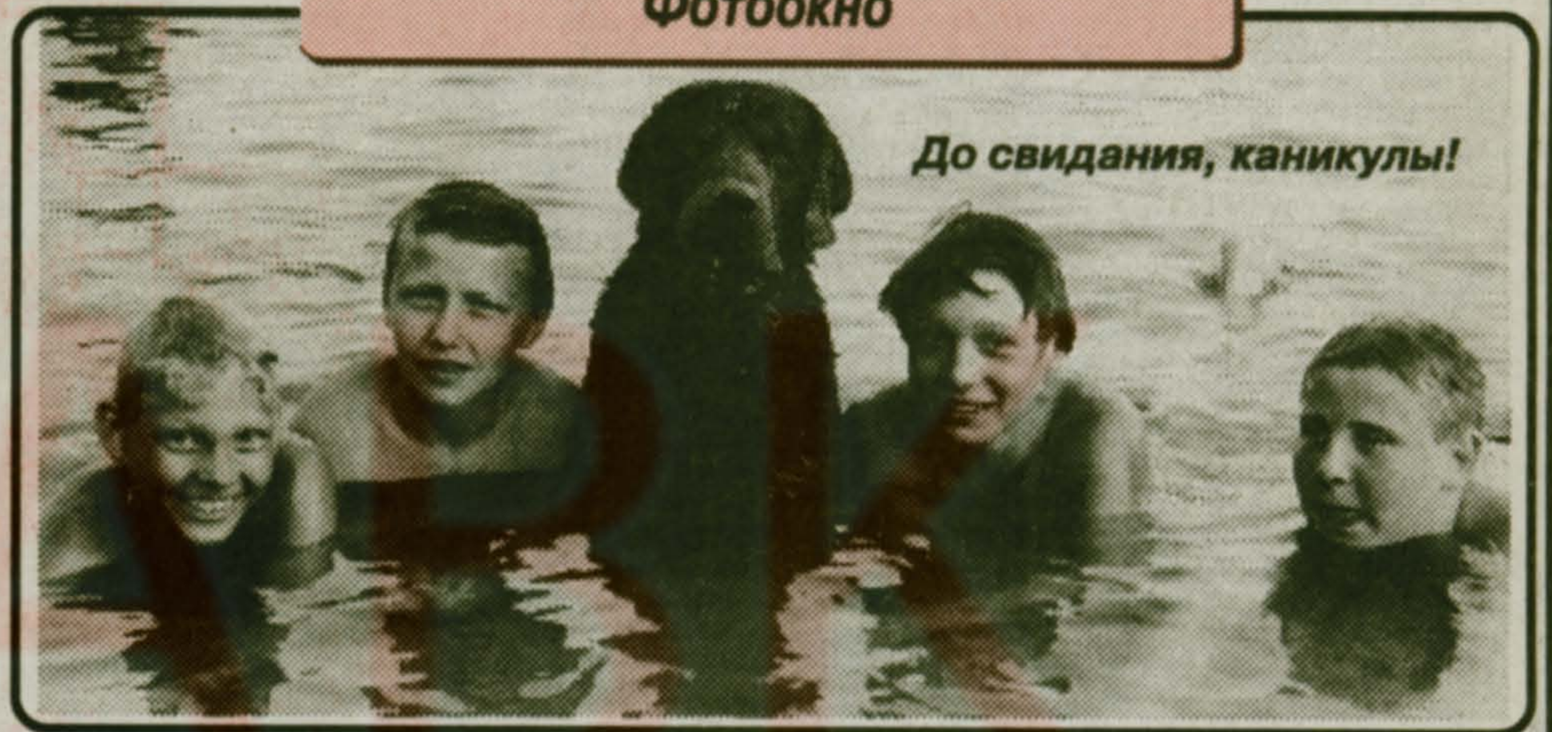
До свидания, каникулы!