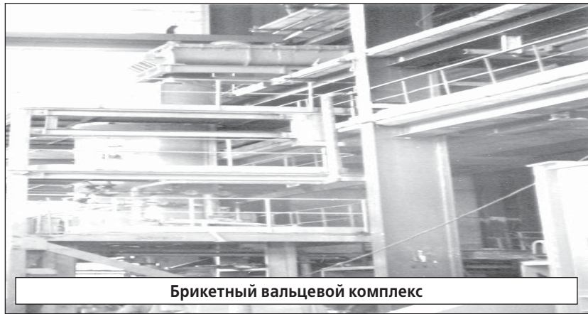
Брикетный вальцевый комплекс