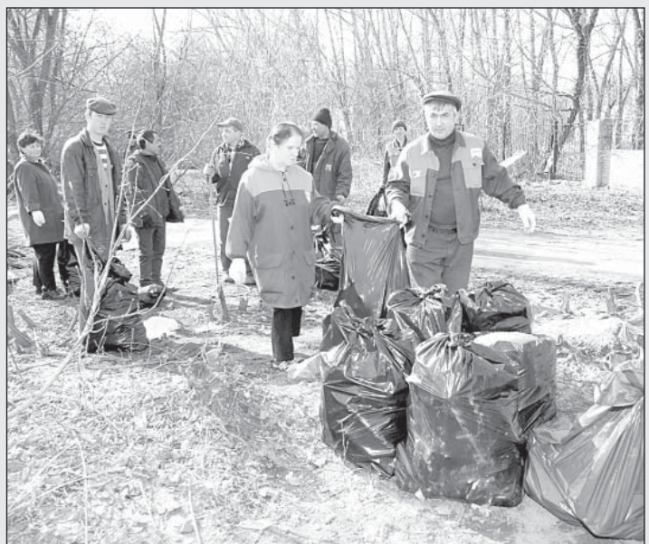
Материалы подготовлены пресс-службой администрации г. Люберцы