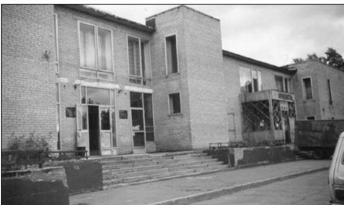
Но таким он был не всегда. Фото 2002 года.