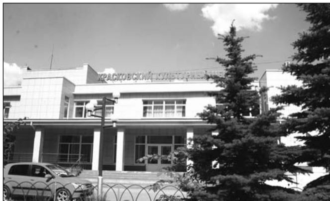
Наша гордость - Красковский культурный центр.