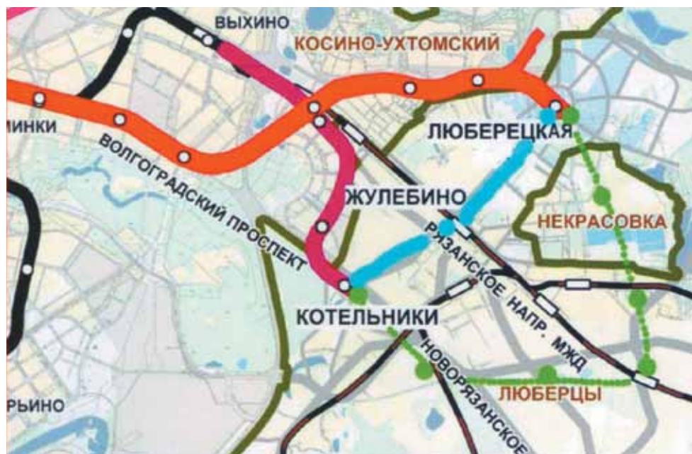
Предлагаемая схема прохождения метро и внеуличного скоростного транспорта