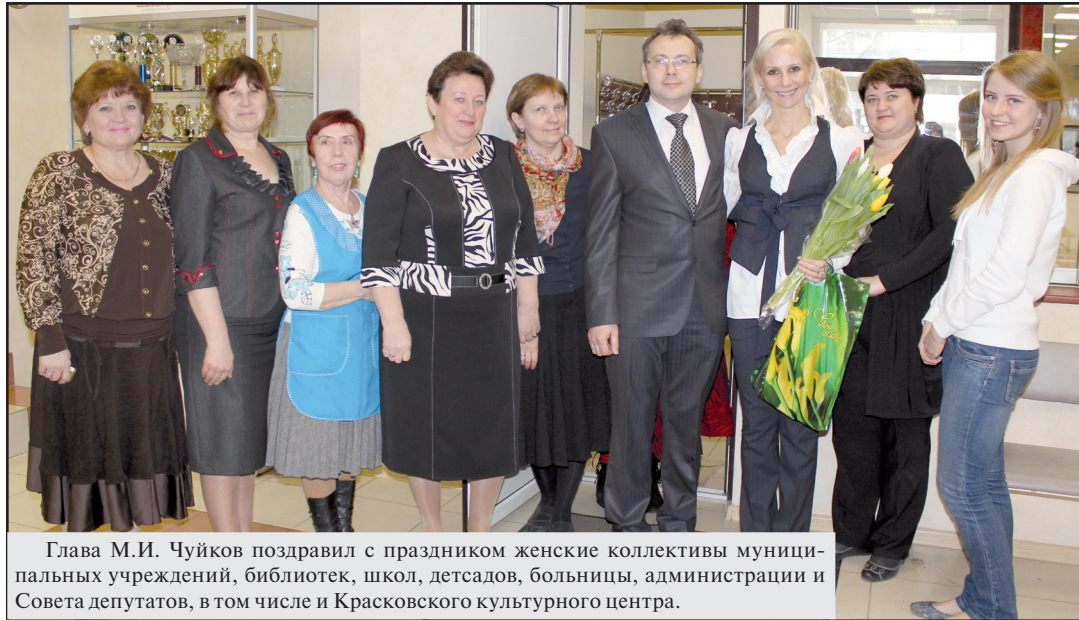
Глава М.И. Чуйков поздравил с праздником женские коллективы муниципальных учреждений, библиотек, школ, детсадов, больницы, администрации и Совета депутатов, в том числе и Красковского культурного центра.

8 Марта — воистину женский праздник. Для наших милых, любимых женщин был устроено настоящее торжество в Красковском культурном центре. Зал был заполнен до отказа. Виновицы торжества надели свои лучшие наряды. У всех было праздничное настроение. Поэтому зал тоже выглядел радостным и нарядным от улыбок.