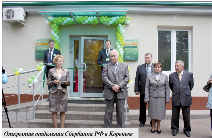
Открытие отделения Сбербанка РФ в Коренево