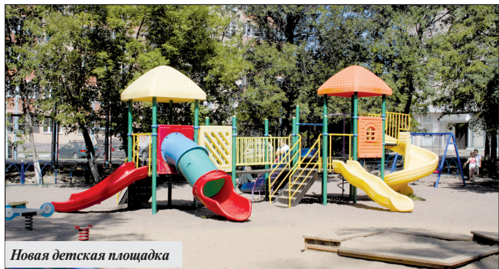
Новая детская площадка