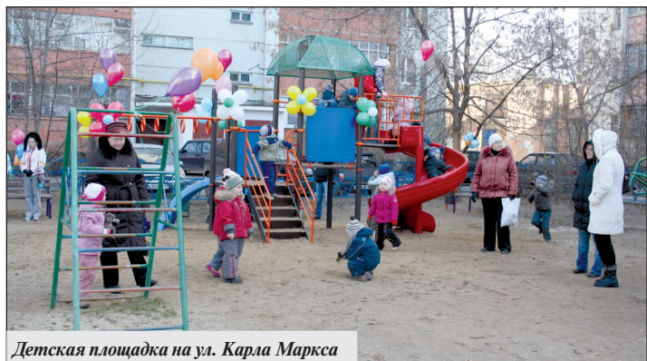
Детская площадка на ул. Карла Маркса