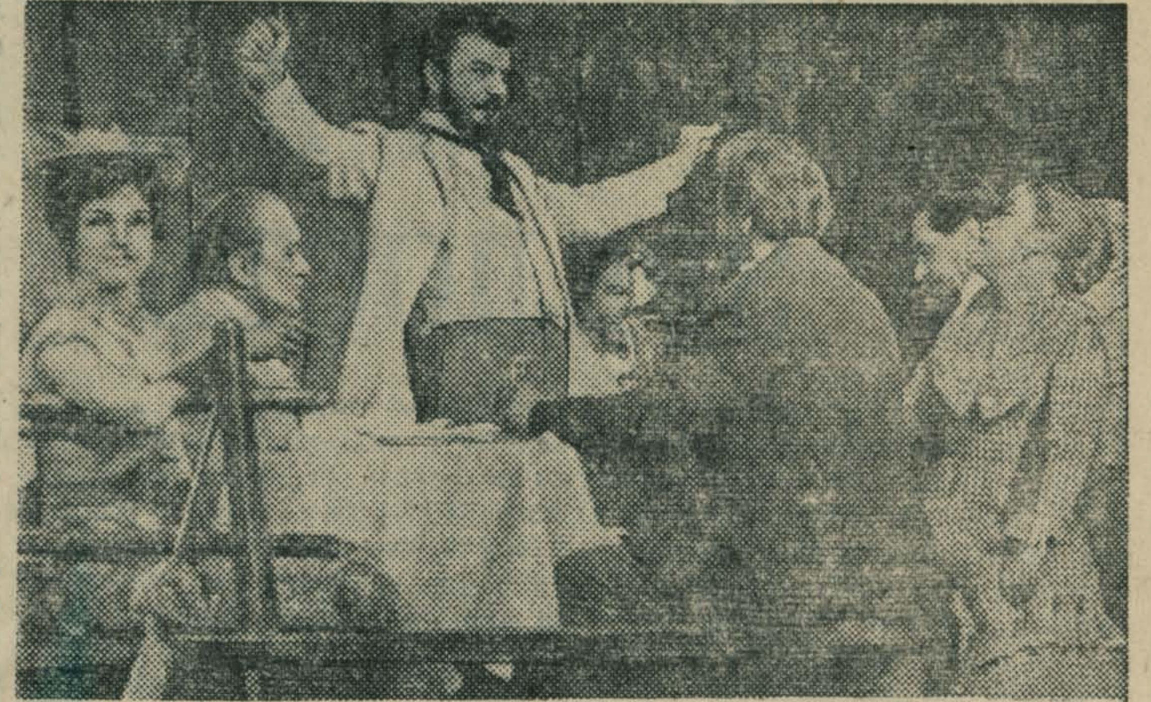
МОСКВА. С пьесой А. П. Чехова «Леший» познакомил зрителей Академический театр имени Евг. Вахтангова.

службе в армии и на флоте. Участники встречи познакомилась с выставкой кинофоторекламного плаката «Народа верные сыны», посмотрели киножурнал «Советский патриот» и художественный фильм «Отряд особого назначения». В ходе фестиваля, который продлится до 23 февраля, будут показаны художественные и документальные фильмы о Советской Армии и Военно-Морском Флоте. Ю. ЗАБИЯКИН, директор кинотеатра «Орбита».