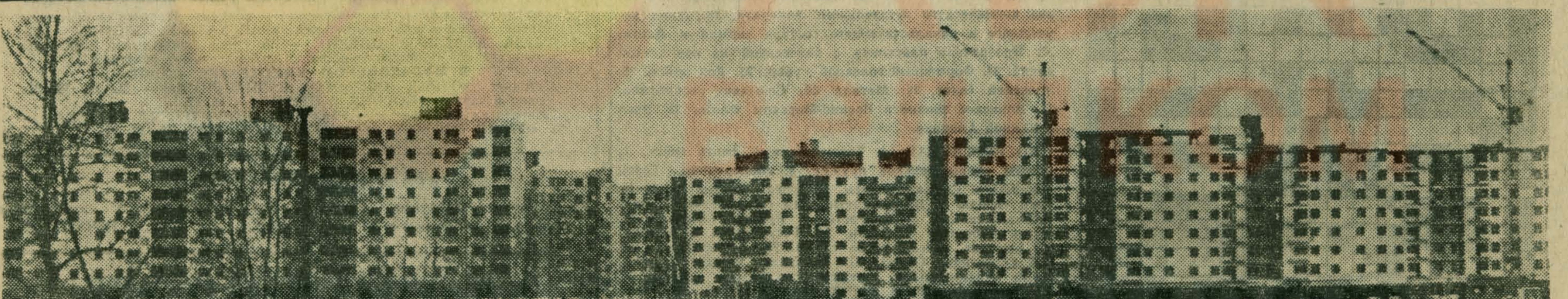
НА СНИМКЕ — далеко не полная панорама четвертого микрорайона города Люберцы. Еще несколько лет назад здесь нельзя было увидеть эти жилые кварталы, состоящие из многоэтажных зданий. Неузнаваемо меняется облик города. И не только его одного. Широкое строительство ведется во всем районе. Красноречивы цифры, которые были названы на XV сессии Люберецкого городского Совета. Только в 1980 году в районе будут построены жилые дома общей площадью 100 тысяч квадратных метров, две школы, четыре дошкольных учреждения, два комбината бытового обслуживания.