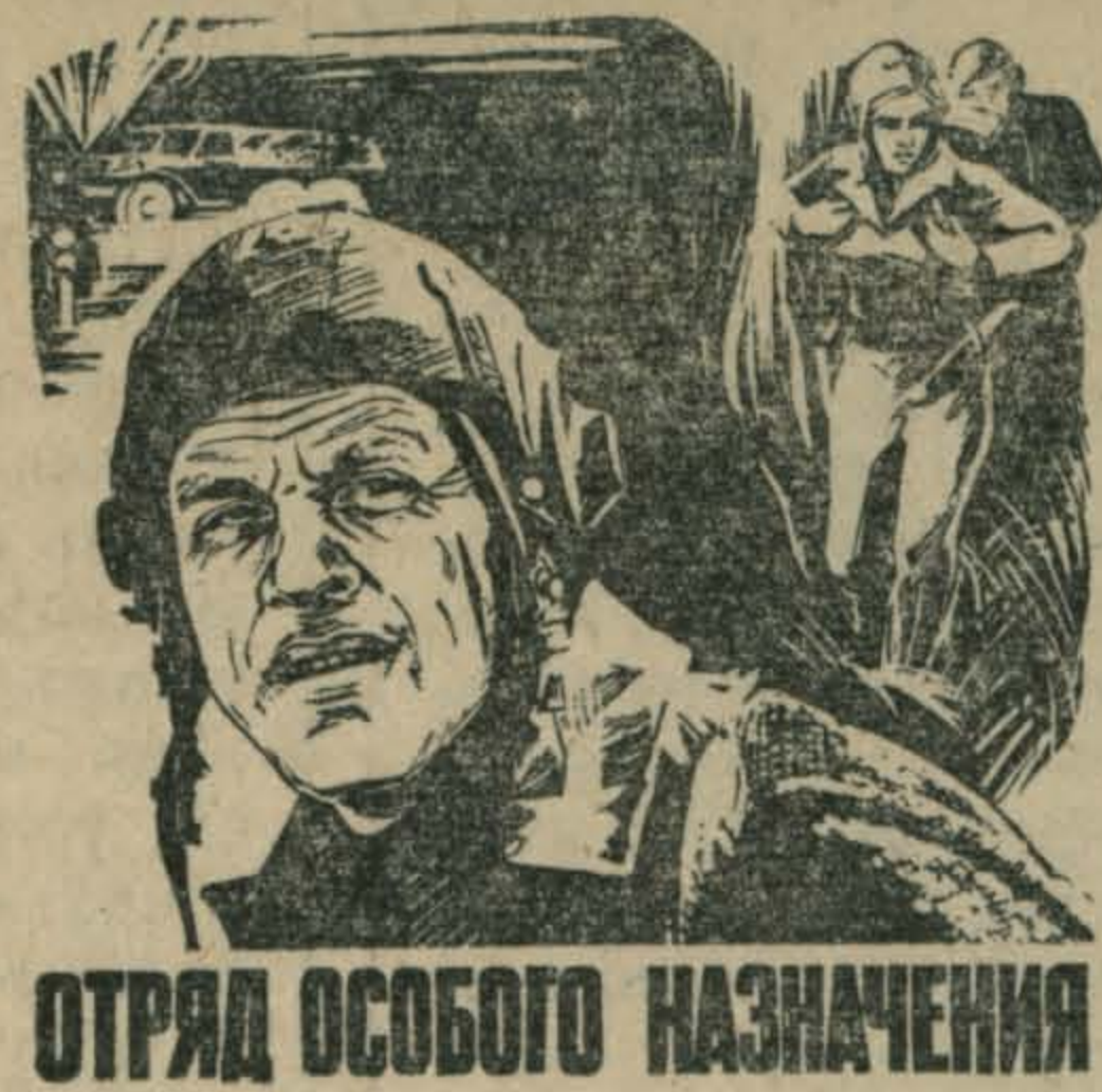
ОТРЯД ОСОБОГО НАЗНАЧЕНИЯ