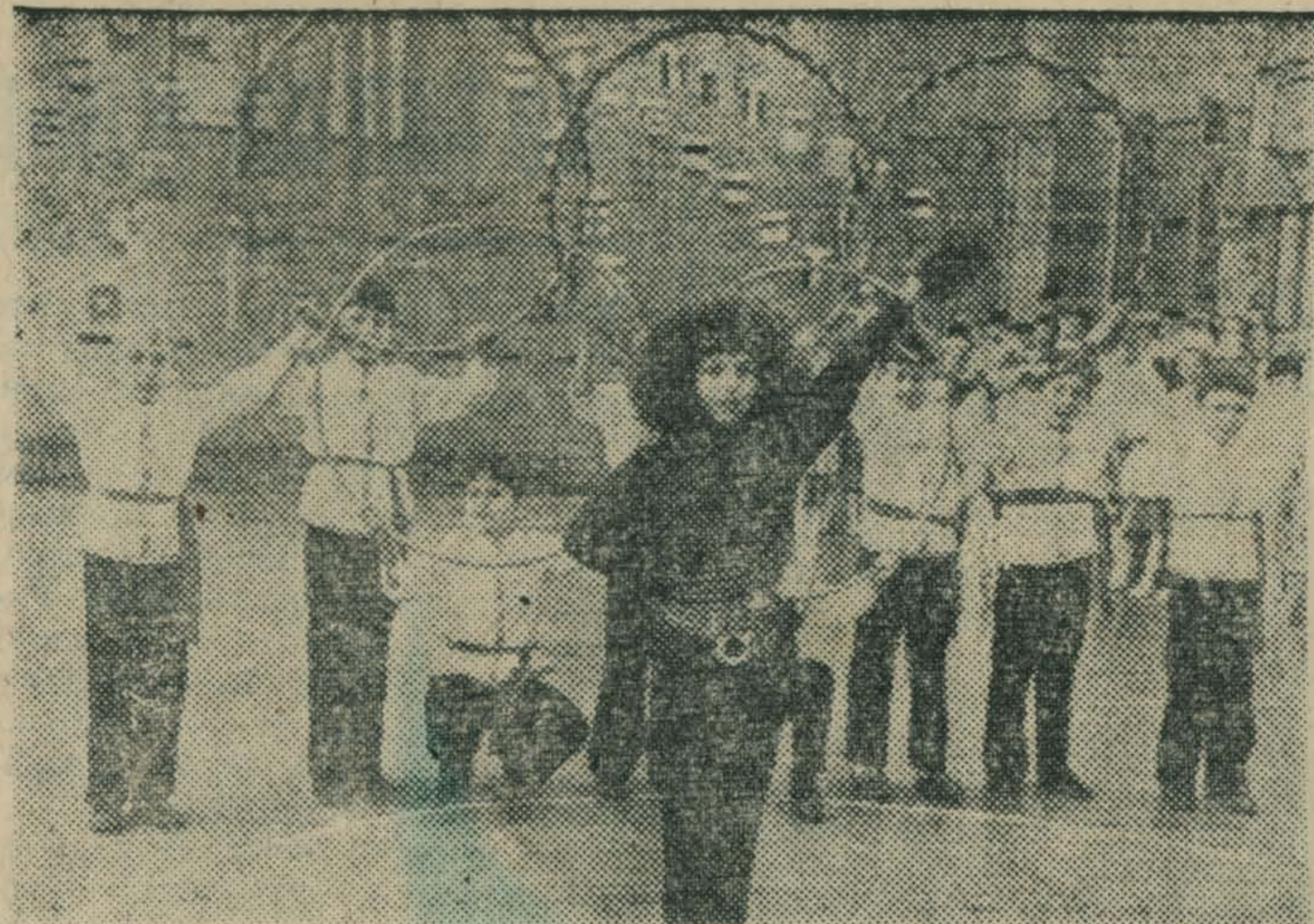
НА СНИМКЕ: на спортивном празднике в косинской средней школе № 24 выступают юные артисты из 3 «б» класса.