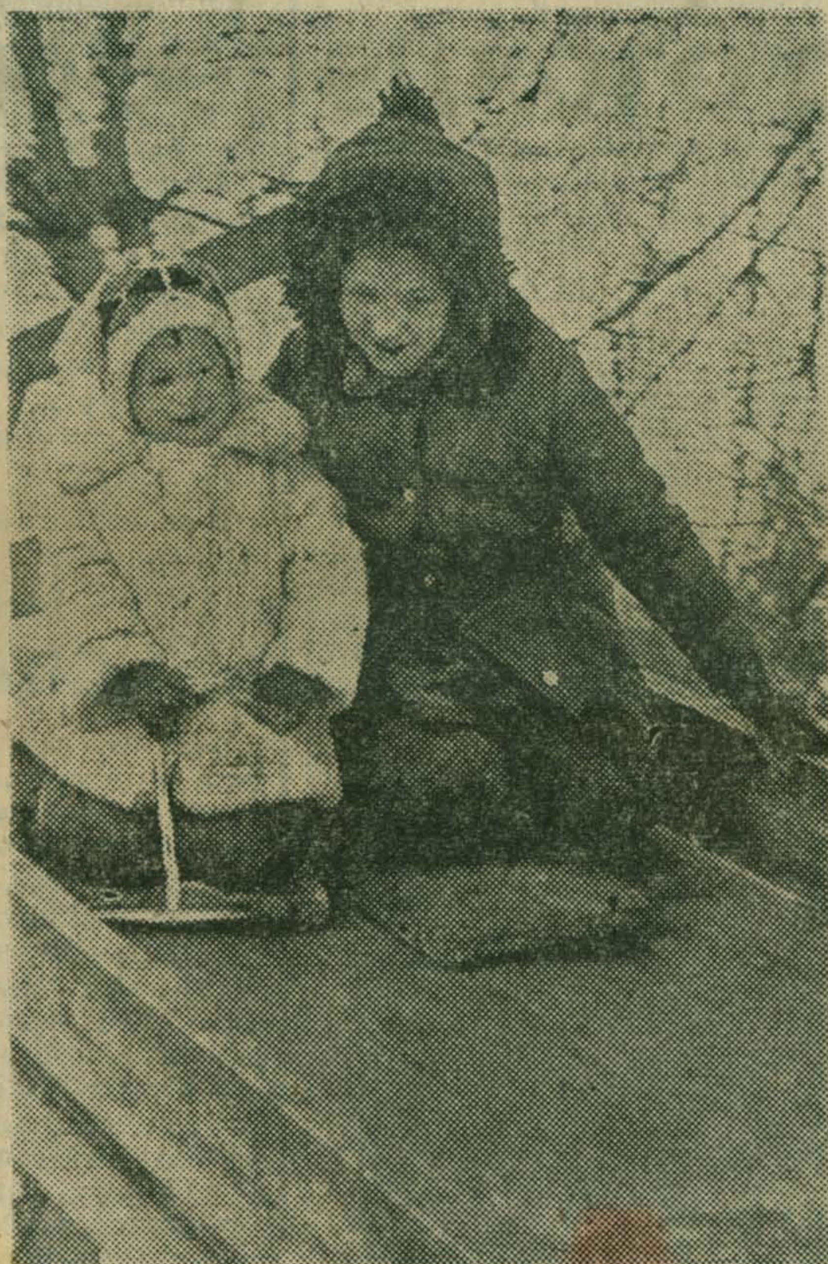
ХОРОШО ПРОМЧАТЬСЯ С ГОРКИ ПО УТРЕННЕМУ МОРОЗЦУ!