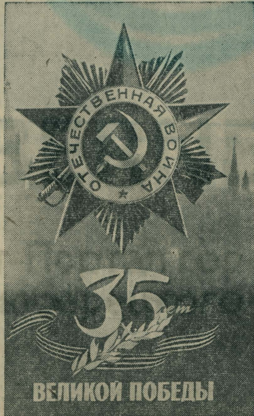
Плакат художника В. Викторова.