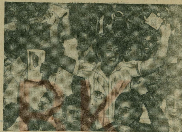
НА СНИМКЕ: ликующие жетели Солсбери во время церемонии провозглашения независимости.

Р. АРЕФУЛОВ, студент факультета журналистики МГУ.