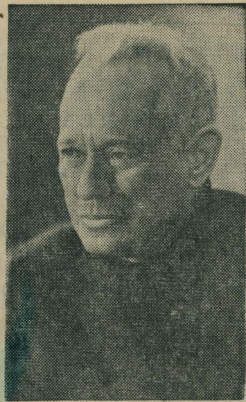
ных партийной мыслью и высоким гуманизмом.

Жизнь народа во всей сложности и противоречивости, в разнообразии человеческих характеров отображена в произведениях Шолохова, наполнен-