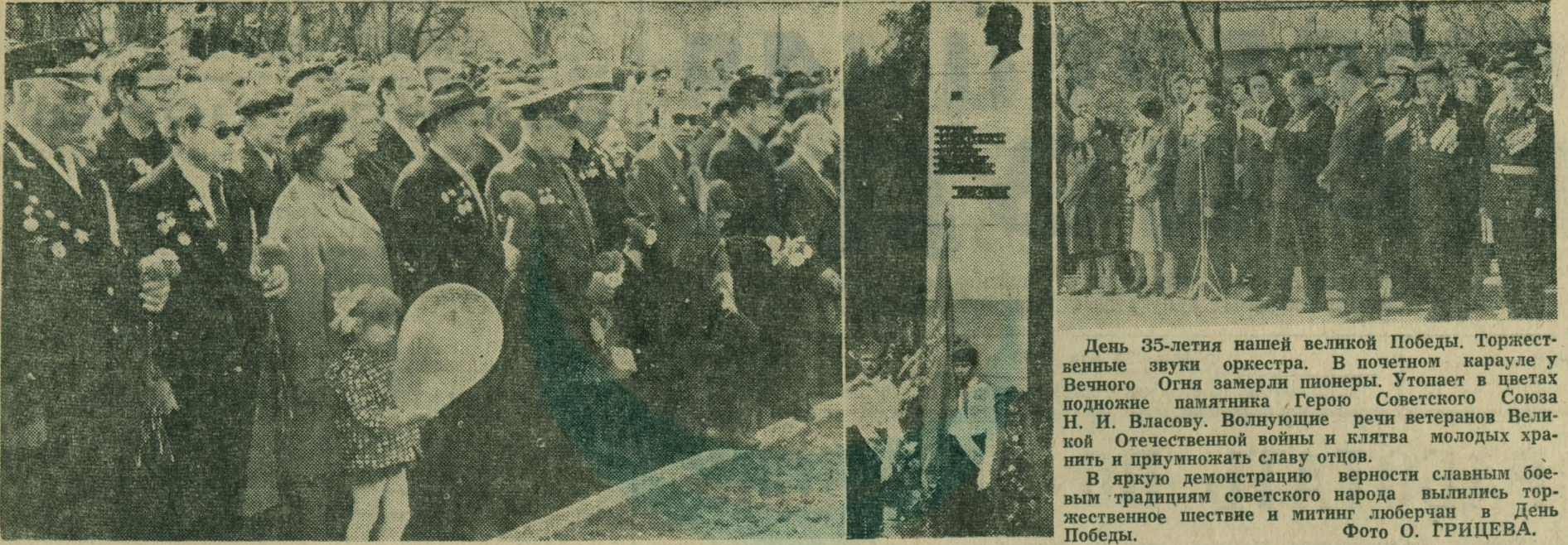
День 35-летия нашей великой Победы. Торжественные звуки оркестра. В почетном карауле у Вечного Огня замерли пионеры. Утопают в цветах подножие памятника Герою Советского Союза Н. И. Власову. Волнующие речи ветеранов Великой Отечественной войны и клятва молодых хранить и приумножать славу отцов. В яркую демонстрацию верности славным боевым традициям советского народа вылились торжественное шествие и митинг люберчан в День Победы.