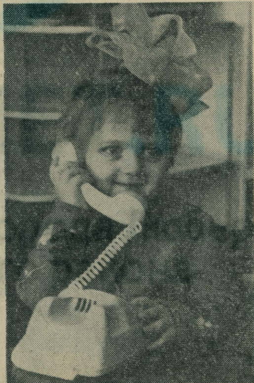
Хорошо услышать ласковый голос мамы, когда она на работе.

В. КИСЕЛЕВ, секретарь комитета ВЛКСМ института физкультуры.