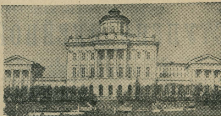
МОСКВА. Государственная ордена Ленина библиотека СССР имени В. И. Ленина — главная из 350 тысяч библиотек страны.

Е. КОКУРИНА, студентка факультета журналистики МГУ.