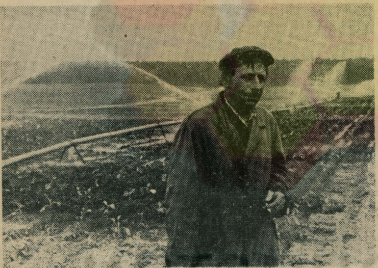
Не зря раньше капусту сажали поближе к водоемам. Не напоишь ее как следует водой — не видать крупных да сочных кочанов.

К. ТИХОМИРОВ, заместитель начальника станции Мальчики.