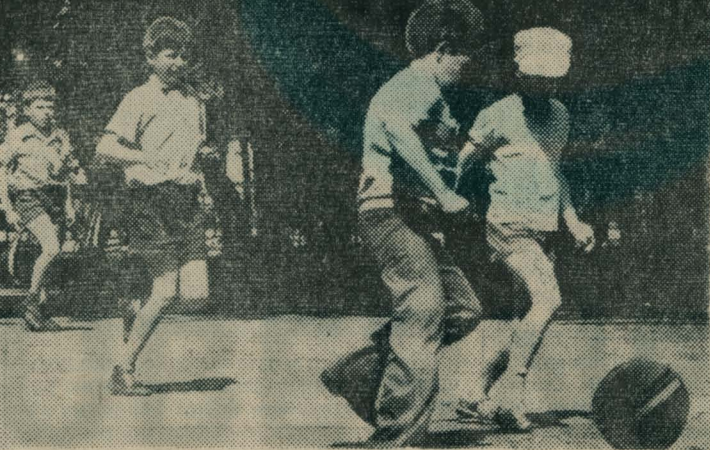
37 городских пионерских лагерей работают нынешним летом в нашем районе. НА СНИМКЕ: на спортивной площадке лагеря при люберецкой средней школе № 6.