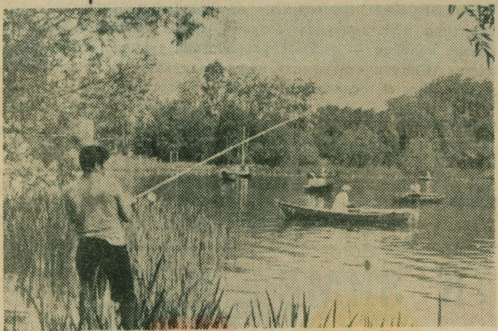
Утро на Белом озере в пос. Косино.