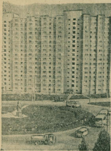
Столица Молдавии — Кишинев. Площадь Конституции.