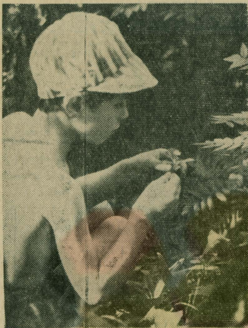
ЛЕТНИЙ ЛЕС — ПОЛНО ЧУДЕС. Фото А. КРАХМАЛЯ.

Ну-ка, Вова, что за слово? Водит пальцем он: — КО-РО-ВА. — Вместе как? — твержу ему. Посмотрел он на картинку И ответил мне: — МУ-МУ. А теперь прочти бабуся, Что вот тут. Он тянет: — ГУ-СП. — Целиком прочти. — Ага. Глянул Вова на рисунок И промолвил он: — ГА-ГА. Вот так штука, путь в науку! Я с сочувствием смотрю: Нелегко дается внуку Первый шаг по букварю.