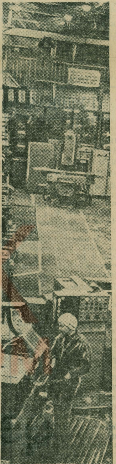
НА СНИМКЕ: участок станков с числовым программным управлением.