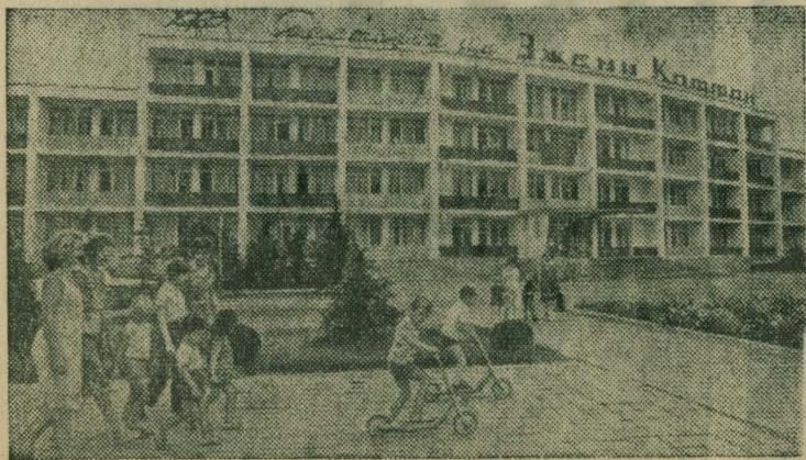
«Граждане СССР имеют право на охрану здоровья. Это право обеспечивается бесплатной квалифицированной медицинской помощью, оказываемой государственными учреждениями здравоохранения, расширением сети учреждений для лечения и укрепления здоровья граждан...» (Конституция СССР, ст. 42).

ми учреждениями здравоохранения, расширением сети учреждений для лечения и укрепления здоровья граждан...» (Конституция СССР, ст. 42).