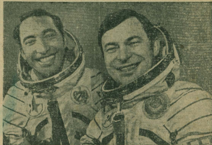
Международный экипаж — командир корабля Ю. В. Романенко и космонавт-исследователь Арнальдо Тамайо Мендес.

26 сентября 1980 года в 18 часов 54 минуты московского времени после успешного выполнения программы совместных исследований и экспериментов на борту орбитального комплекса «Салют-6» — «Союз-37» — «Союз-38» международный экипаж в составе Героя Советского Союза летчика-космонавта СССР Юрия Романенко и космонавта-исследователя гражданина Республики Куба Арнальдо Тамайо Мендеса возвратился на Землю. Работу на станции «Салют-6» продолжают космонавты товарищи Попов и Рюмин.