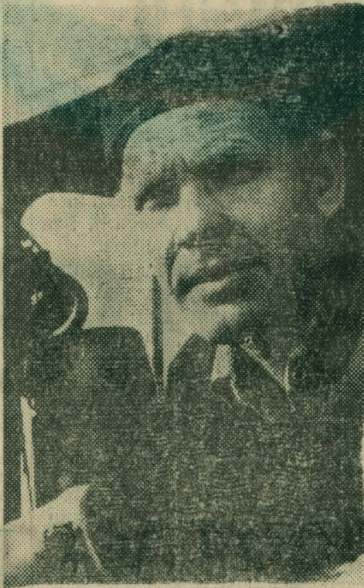
свекловичного поля. Коллектив хозяйства настроен закончить уборку к 5 октября.

И. РУСАК, начальник цеха кормопроизводства.