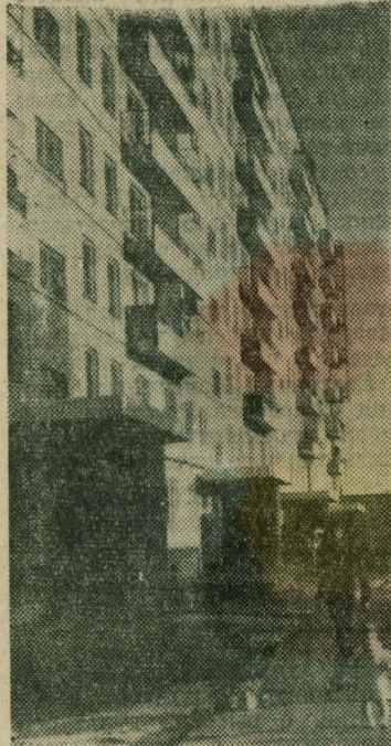
Дом, который вы видите на этом снимке, построил на пажах с научно-вычислительным центром в поселке Косино совхоз им. Моссовета. Здесь недавно справили новоселье 70 совхозных семей.