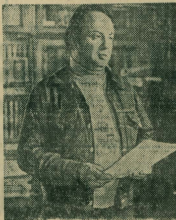
НА СНИМКЕ: поэт Анатолий Прелевский. За поэмы «Насыль», «Станция», «Заповедник», рассказывающие о покорителях Сибири, представлен на соискание Государственной премии СССР 1980 года Московской организацией Союза писателей РСФСР.

НА СОИСКАНИЕ ГОСУДАРСТВЕННОЙ ПРЕМИИ СССР 1980 ГОДА