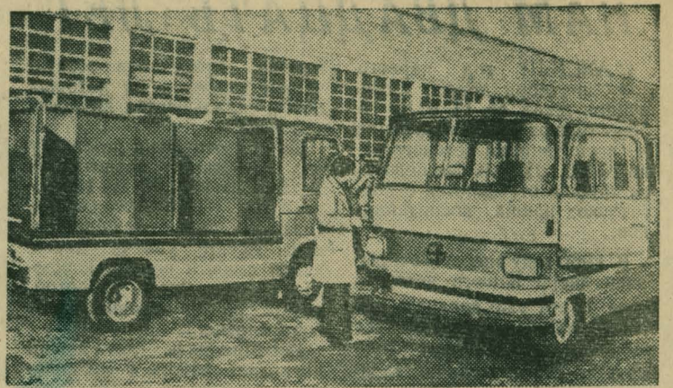
БОЛГАРИЯ. «Элмобус» — так назван пробный образец электроавтомобиля-автобуса (на снимке), созданного конструкторами Софийского института электро- и мотокаров. Ими спроектирована также модель электроавтомобиля-грузовика. Эти машины предназначены для предприятий торговли и бытового обслуживания, а также для перевозки пассажиров в курортных районах. Электроавтомобили способны быстро набирать скорость до 50 километров в час, просты в эксплуатации и обслуживании.