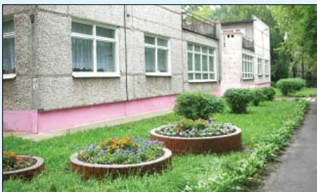
Островок уюта и красоты. Окружен цветниками детсад №83, вокруг чистота и порядок - Люберцы, ул. Авиаторов.