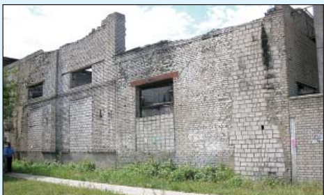
Падающая стена. Запущена территория - Красково, ул. К. Маркса, 117, ВНИИСТРОМ.