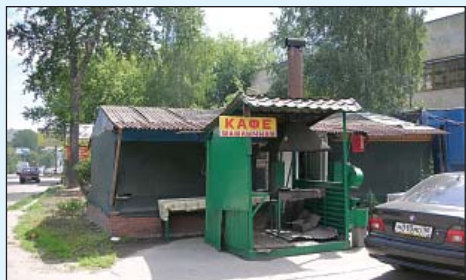
Антисанитария у кафе в Томилино, Егорьевское шоссе, 4 км.

но 24 рейда, оформлено 52 предписания, государственным административно-техническим надзором наложены крупные денежные штрафы.