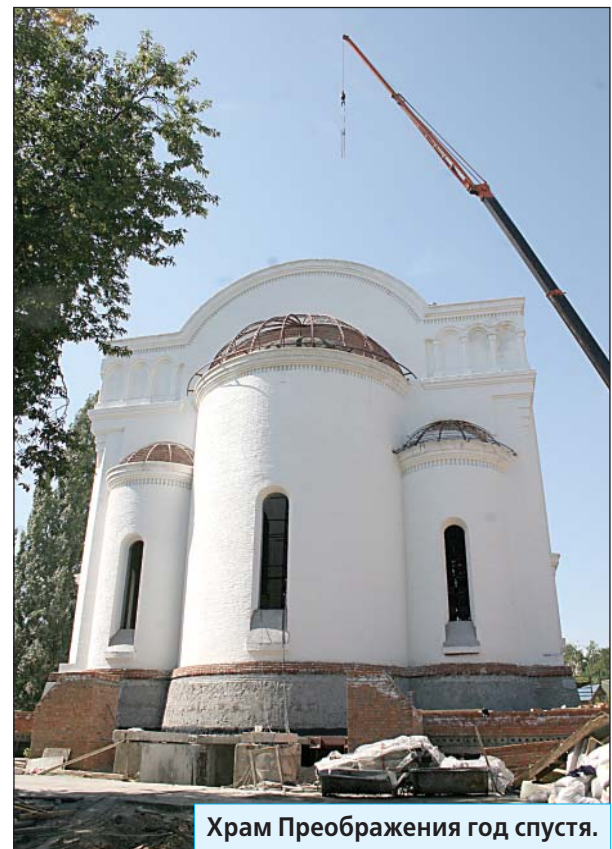
Храм Преображения год спустя.