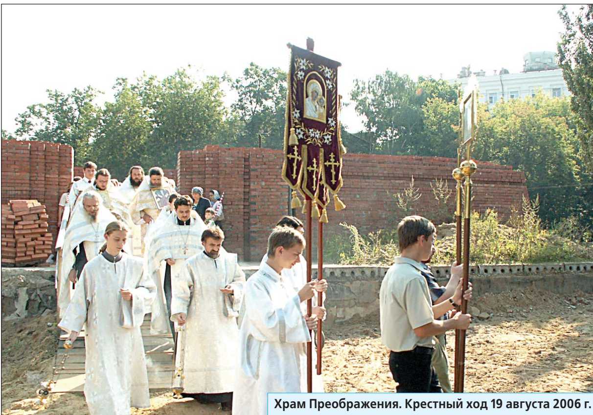
Храм Преображения. Крестный ход 19 августа 2006 г.

Праздничные службы пройдут в этот день и во всех храмах Люберецкого благочиния. Особенно торжественно и многолюдно будет в двух храмах земли люберецкой, где этот праздник престольный. Накануне волнующего, радостного события именно там и побывали корреспонденты нашей газеты.