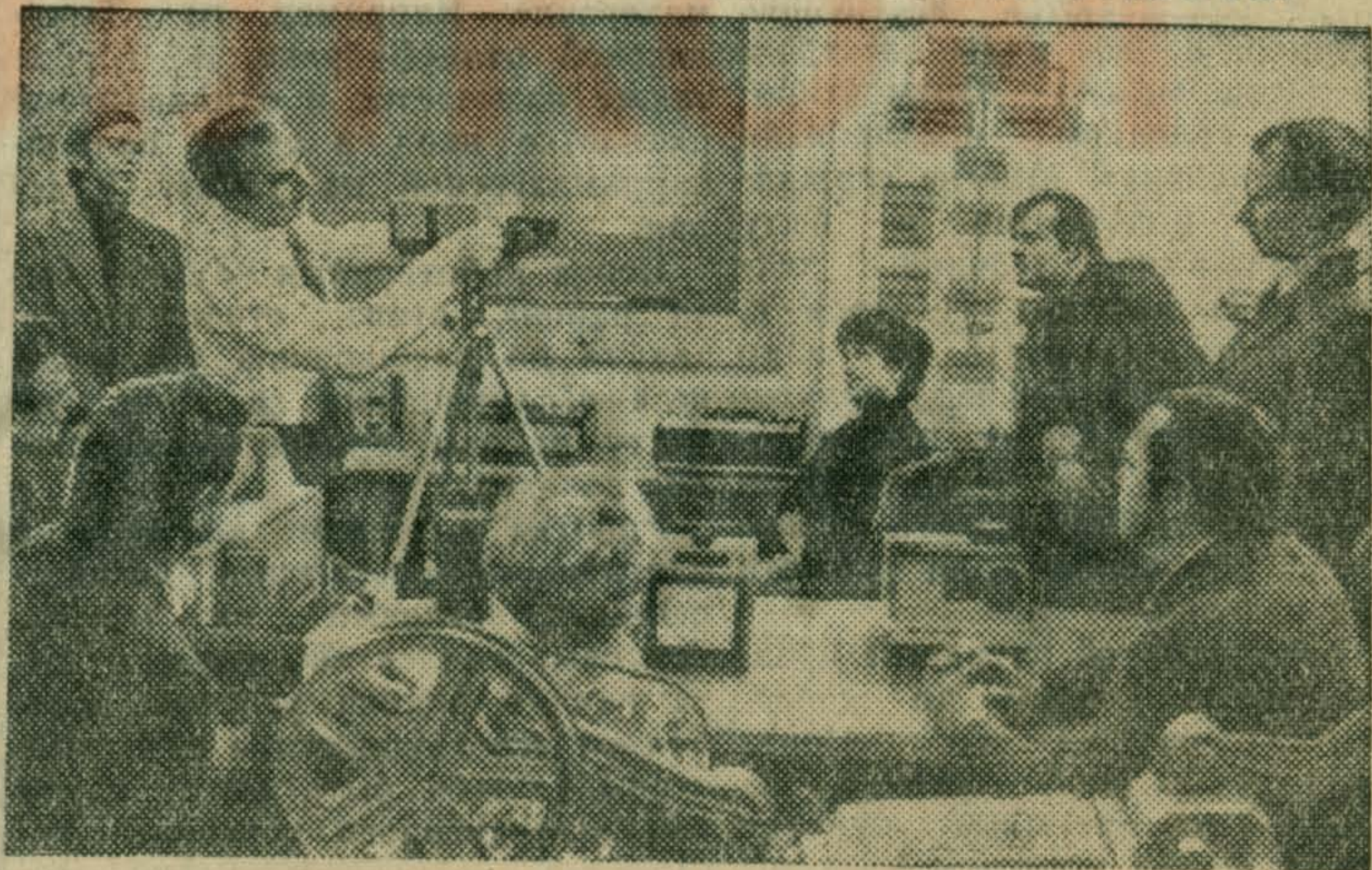
ЦЕНТР НАУЧНО-МЕТОДИЧЕСКОЙ РАБОТЫ