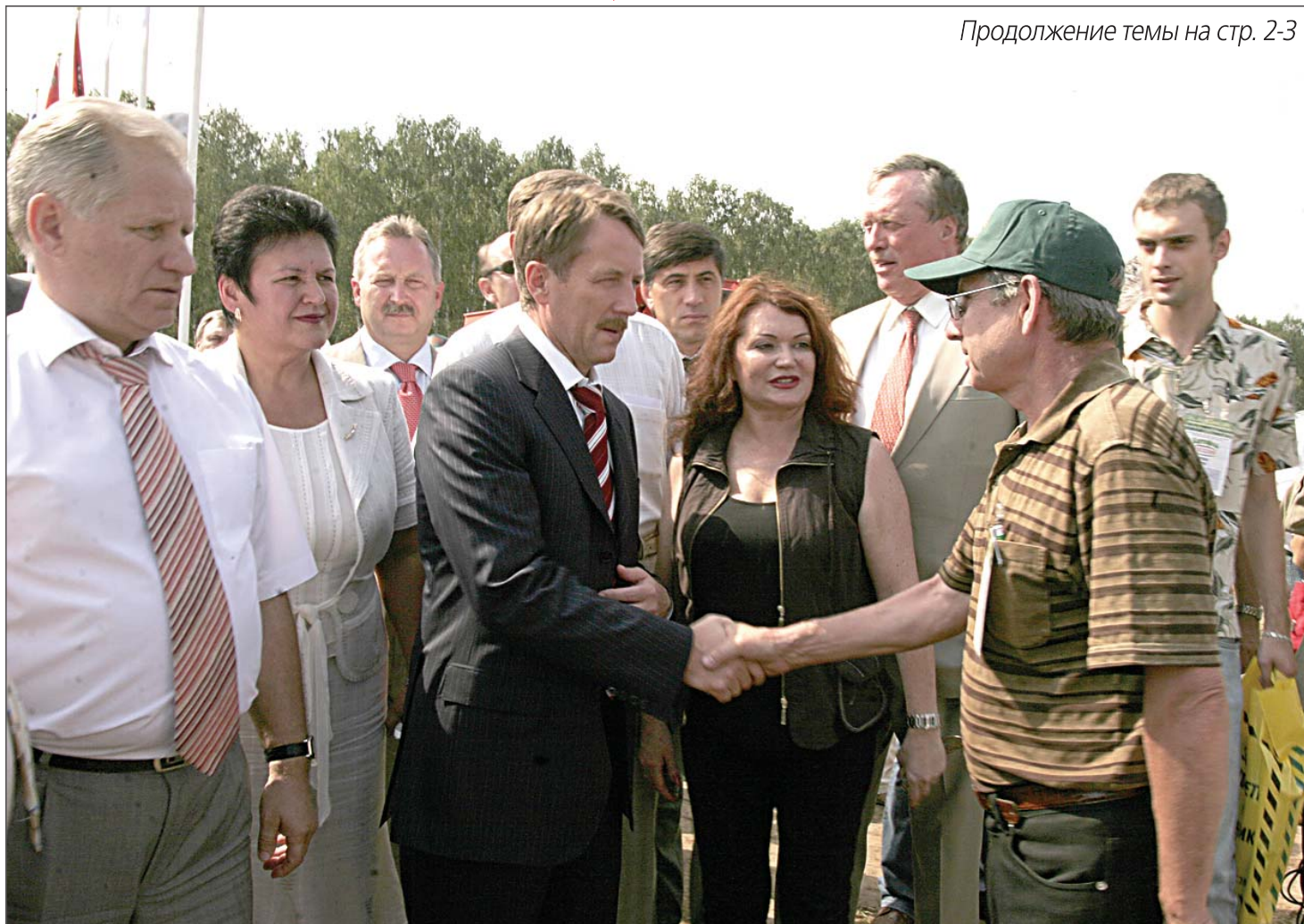
Продолжение темы на стр. 2-3