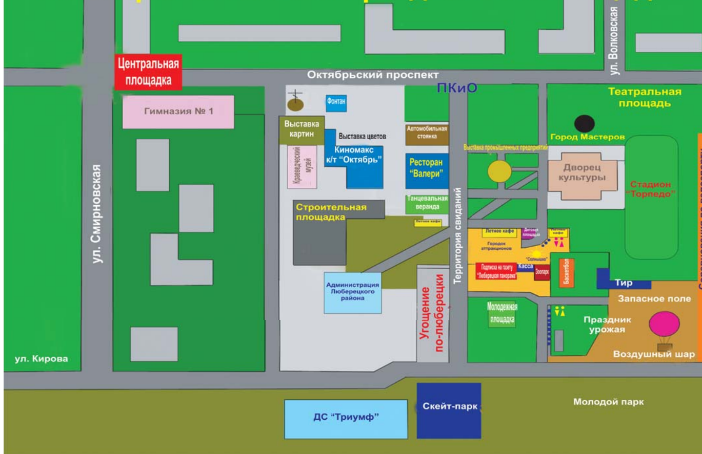
Схема расположения праздничных площадок