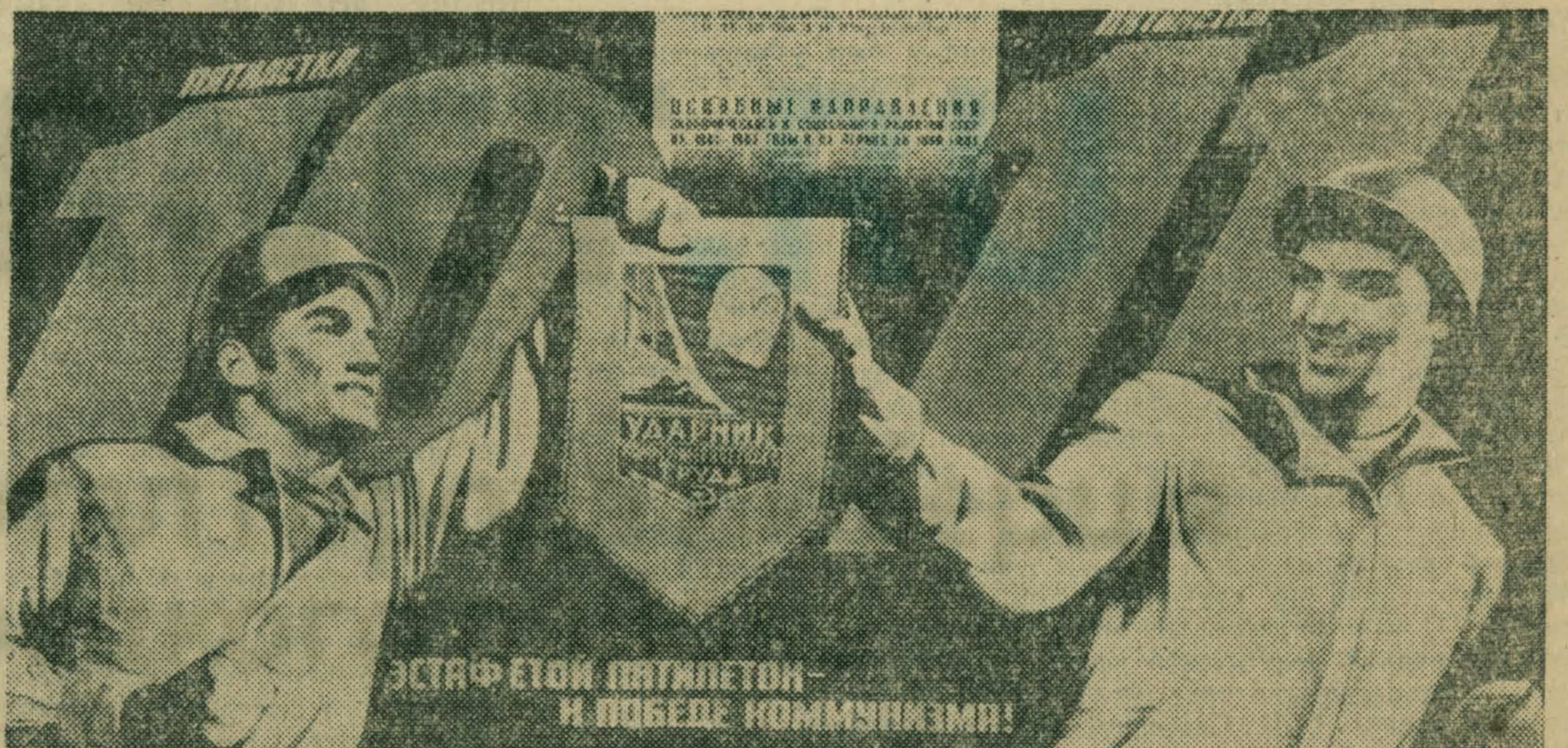
Плакат художника В. Корецкого. Издательство «Плакат».